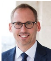
Staatsminister Kai Klose